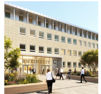
Visualisierung Corpus Sireo

Die Fragen zur zukünftigen Nutzung der Gebäude und den damit verbundenen Folgen für die Anwohner wurden leider nicht umfassend beantwortet. Immerhin wurde mitgeteilt, dass es u.U. nicht bei einer klassischen Büronutzung bleibt. Corpus Sireo ist auch im Gespräch mit Bildungsanbietern, Arztpraxen etc. Ferner bestätigte man, dass Corpus Sireo selbst auf den Campus II bzw. „Rheinzeit“ einziehen wird. Es blieben zahlreiche Fragen u.A. zum absehbaren Parkchaos, den Defiziten in der Nahversorgung und vielem mehr, unbeantwortet.